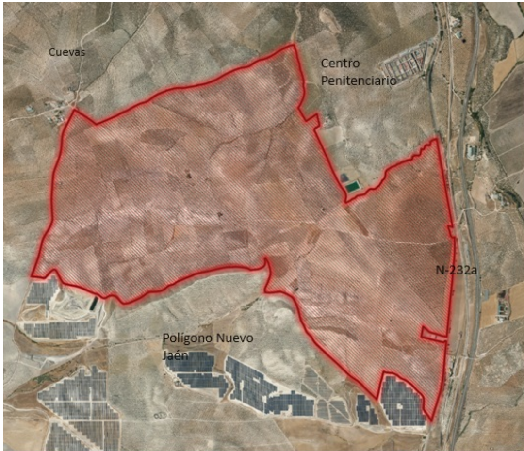
Listado de Parcelas Afectadas