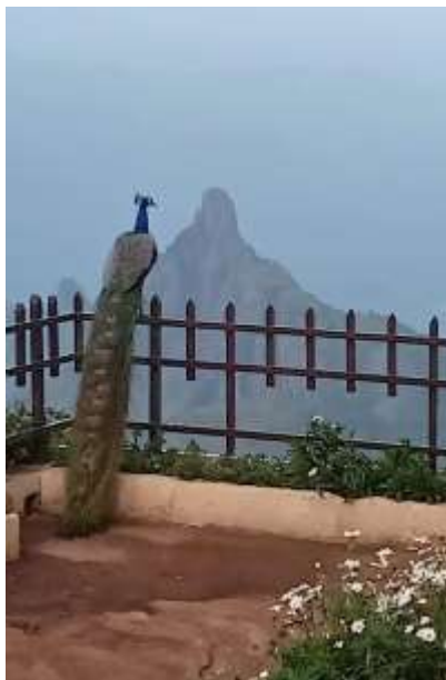
Pavo real en la Montaña del Maestro, Nilagiris